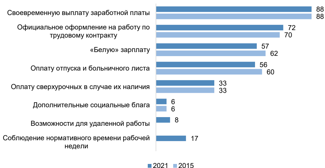
Рисунок 2 – Динамика уровня обеспеченности социальных гарантий для российских работников, 2015–2021 гг., % (последние 2 закрытия не предлагались в 2015 г.)

Дополняет данные результаты и анализ другого аспекта объективного социального благополучия работника – уровня его социальной защищенности, который на российском рынке труда в целом невелик вне зависимости от формы занятости работника. Как свидетельствуют данные рисунка 2, зачастую единственной социальной гарантией для российского работника является своевременное получение им заработной платы. Такая ситуация в целом сохраняется на протяжении последних 6 лет и лишь слегка усугубилась с наступлением коронакризиса. Поэтому даже масштабы сокращения официальной безработицы совсем не гарантируют повышения социальной защищенности работника, что также говорит об определенном положении индивида в системе производственных отношений и, как показали результаты нашего анализа, тесно связано с уровнем социального благополучия работника в разных его проявлениях.