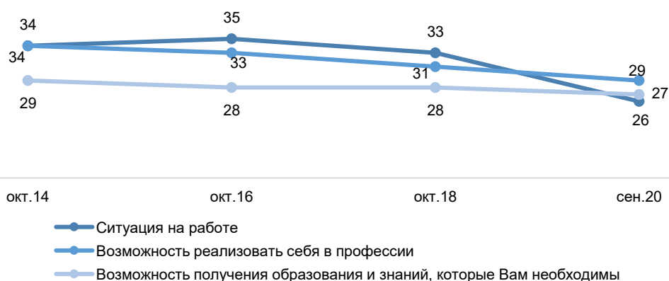
Рисунок 4 – Динамика субъективных оценок как хороших в отношении: ситуации на работе, возможностей профессиональной самореализации и обучения, 2014–2021 гг., % от работающих

Субъективное благополучие на рабочем месте. Вышепредставленные объективные последствия пандемии, как видно из рисунка 4, сказались также и на самооценке работающих россиян. Видимый скачок вниз был замечен в сентябре 2020 г., но уже к началу 2021 г. в самосознании занятого населения ситуация несколько стабилизировалась. Но с точки зрения объективных показателей, как было показано выше, ситуация скорее обострилась. Такое, на первый взгляд, противоречие, вероятнее всего связано со снижением градуса неопределенности, вызванной пандемией. Не наблюдается и роста негативных оценок, а большинству опрошенных ситуация на работе (60 %), а также возможности профессиональной самореализации (54 %) и образования (58 %) видятся удовлетворительными. Однако такое смещение к середине не имеет однозначной интерпретации и нуждается в уточнении. В частности, отечественные исследователи фиксируют похожие тенденции и в отношении субъективных оценок россиянами других сторон жизни, обосновывая массовое стремление к середине туннельным эффектом, слабой связью объективной ситуации с ее восприятием (Гимпельсон и др., 2020), ориентацией на ближнее окружение (Тихонова, 2018).