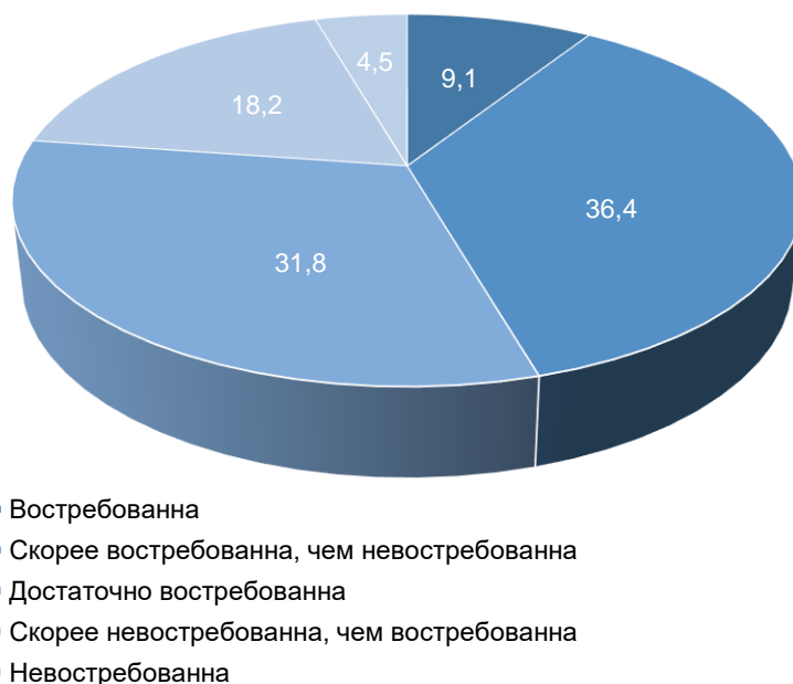
Рисунок 2 – Распределение мнений студентов о востребованности их будущей профессии, %

Степень востребованности выбранной профессии также имеет ключевое значение для каждого студента, поскольку связана с будущей профессиональной деятельностью, с возможностью зарабатывать, вносить свой вклад в производство общественно полезного продукта. Нами выявлено, что лишь небольшая часть студентов (9,1 %) считает свою будущую профессию полностью востребованной. Скорее востребованной ее находят 36,4 % ответивших, достаточно востребованной – 31,8 %, скорее невостребованной, чем востребованной, – 18,2 % респондентов. Невостребованной свою профессию называют 4,5 % студентов (рис. 2).