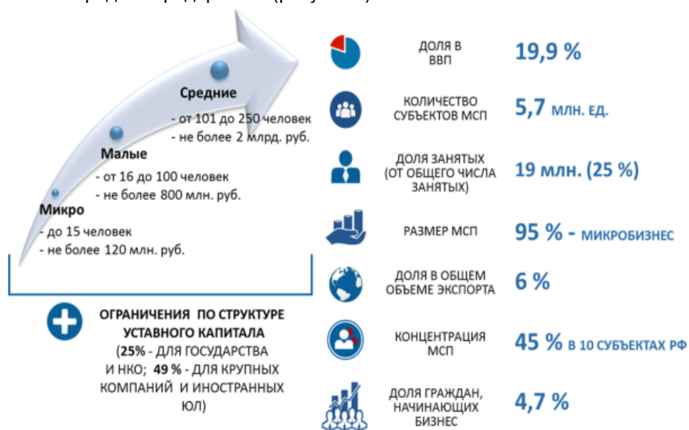
Рисунок 1 – Значение МСП в экономике

В сфере МСП действует более 5 млн микропредприятий, около 260 тыс. малых предприятий и более 20 тыс. средних предприятий (рисунок 1).