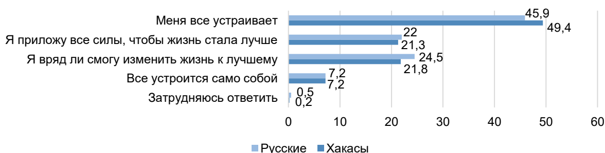
Рисунок 2 – Оценка своей жизни русскими и хакасами, приехавшими из села, % опрошенных

Несмотря на побудительные мотивы миграции, только одна пятая часть опрошенных (22 % русских и 21,3 % хакасов) выразила готовность прикладывать усилия, чтобы улучшить свою жизнь (рис. 2). Можно считать, что адаптационный потенциал у этой части опрошенных самый высокий.