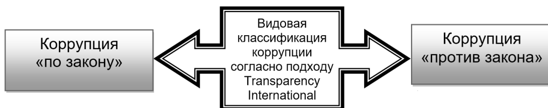
Рисунок 3 – Основные виды коррупции согласно типологии Transparency International

Определение коррупции, сформулированное Transparency International – неправительственной международной организацией по борьбе с коррупцией, сводится к тому, что данный экономико-поведенческий феномен представляет собой злоупотребление полномочиями, возложенными на человека, в личных интересах. Следует отметить, что специалисты данного агентства выделяют коррупцию «по закону» и коррупцию «против закона» (рисунок 3), при этом между названными видами проводятся следующие различия. Так, первый тип известен и распространен как оплата объектов – взятки позволяют получить приоритет при оказании услуги от получателя взятки в соответствии с действующим законодательством. Второй вид отражает деятельность должностных лиц в общественном или частном секторе, политиков или государственных служащих, направленную на то, чтобы обогатить себя или родственников незаконным путем либо с помощью злоупотребления предоставленной властью.