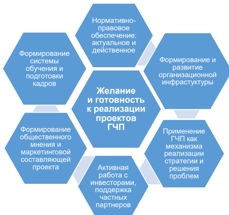
Рисунок 1 – Условия для развития механизма ГЧП в регионе

С учетом этого мы сформулировали необходимые условия, направленные на формирование в регионе действенной нормативно-правовой базы, развитие организационной инфраструктуры, активную работу с инвесторами и др. (рисунок 1).