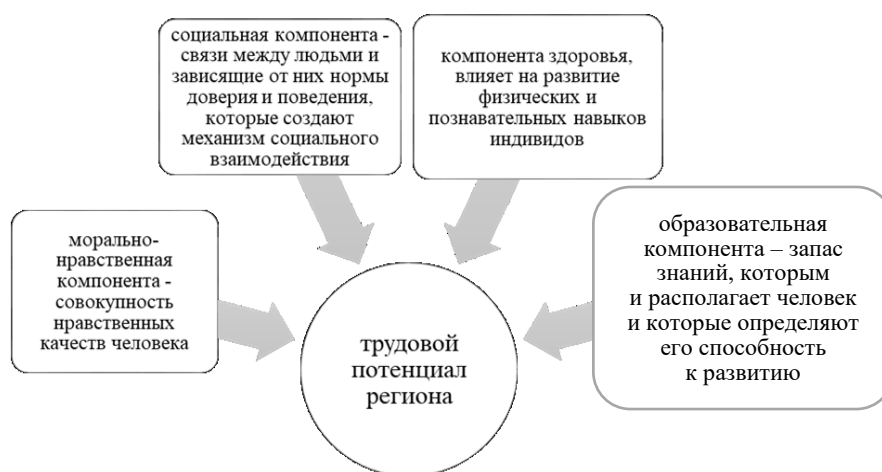
Рисунок 1 – Компонентная структура трудового потенциала региона

В связи с вышеизложенным анализ эффективности использования региональных активов осуществлен на примере оценки формирования и реализации трудового потенциала субъектов Центрально-Черноземного экономического района (ЦЧЭР) (период исследования – 2010–2016 гг.), которая произведена на основе использования методического подхода, предполагающего включение в структуру исследуемой категории потенциала здравоохранения, а также социального, морально-нравственного, образовательного потенциалов (рисунок 1).