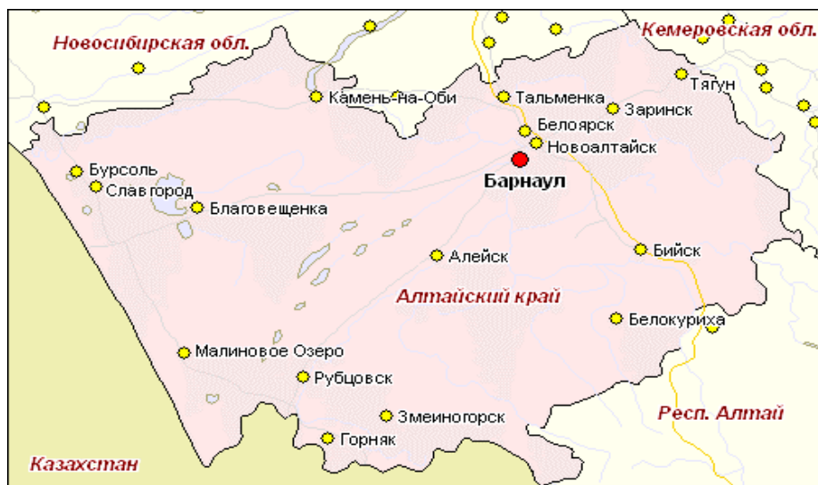
Рисунок 1 – Географическое расположение Алтайского края