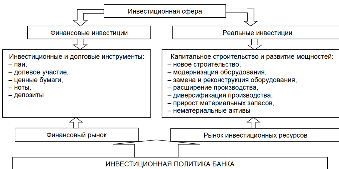
Рисунок 1 – Направления инвестиционной политики банка

Общий экономический фон, на котором формировалась инвестиционная политика банков и предприятий в последнее время, может быть охарактеризован следующими данными (табл. 1, 2) [2].