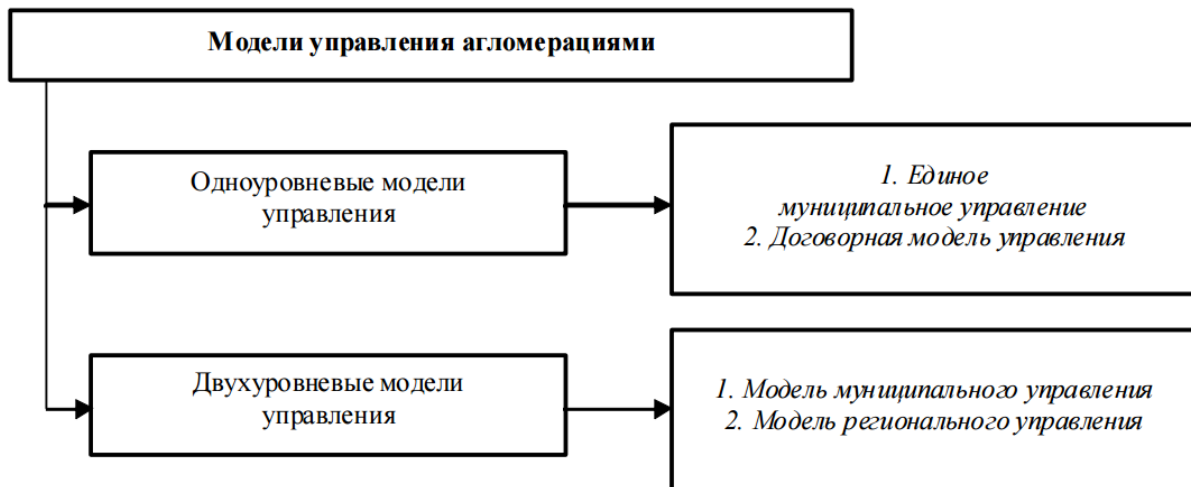
Рисунок 1 – Модели управления агломерациями

В качестве модели управления агломерацией на территории Белгородской области данным проектом закона предлагается третья форма – договорная модель в рамках осуществления межмуниципального сотрудничества. В сравнении с другими она имеет наиболее гибкую систему управления за счет договорного принципа принятия решений. Также крайне важно, что подобная модель может быть реализована в рамках действующего российского законодательства.