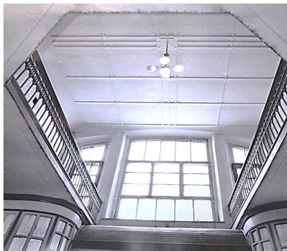
Рисунок 5 – Главный вход. 1985