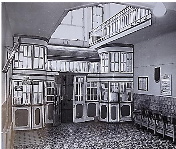
Рисунок 4 – Фрагмент интерьера холла. Фото П.К. Скирда. 1985

К концу XX в. в интерьерах бани (рис. 4–6) сохранились лепные украшения, на потолке вестибюля повторяющие декор главного фасада, потолки банного и душевых отделений в виде армокирпичных цилиндрических оболочек. Сохранились плиточные многоцветные полы. Лестница вестибюля с коваными ограждениями выполнена в стиле «модерн». Конструкции здания: фундаменты и стены – кирпичные, перекрытия – армокирпичные. Габаритные размеры: ширина – 35,5 м, длина – 40,1 м.