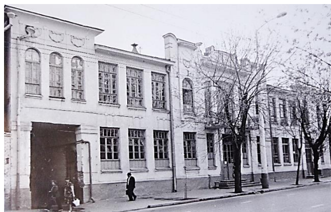
Рисунок 1 – Баня купца А.Д. Адамули. 1982

Баня купца Адама Дмитриевича Адамули по ул. Октябрьской (до революции – ул. Посполитакинская) является одним из ярких образцов провинциального «модерна». Построенное в 1891 г. [17], столь привычный нам облик здание обрело к 1902 г. (рис. 1) [18].