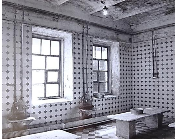
Рисунок 6 – Фрагмент интерьера банного отделения. 1985

Оригинальное архитектурное решение и высокий профессиональный уровень исполнения здания дают основание считать его одним из лучших образцов стиля «модерн» в г. Екатеринин-даре. В нем удачно решен принцип единства экстерьера и интерьера.