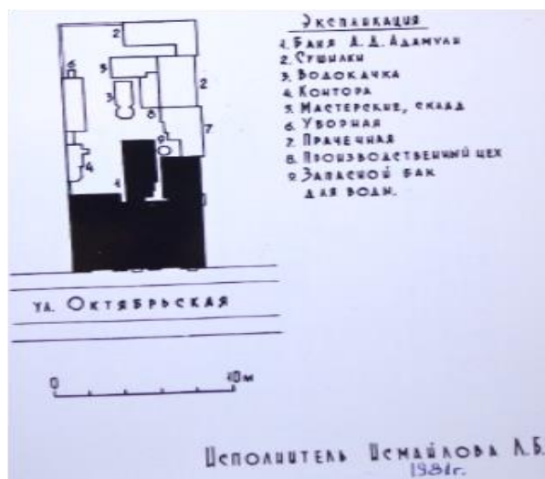
Рисунок 2 – Экспликация

ризалита – центральный с главным входом и фланкирующим, северный – со сквозным прямоугольным проездом во двор, южный – с входом в душевые и ваннные отделения. В плане здание представляет собой несимметричную сложную композицию функционально связанных объемов, состоящих из основных помещений, котельной, душевых и ваннных номеров (рис. 2, 3).