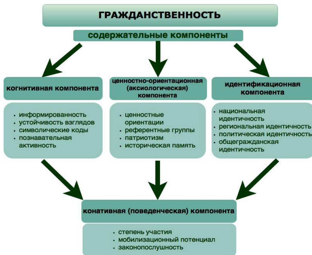
Рисунок 1 – Содержательные компоненты гражданственности

В основу исследования легло понимание, что феномен гражданственности имеет сложную структуру. Среди ее компонентов мы выделили когнитивную (выражается в категориях информированности и знания), аксиологическую (степень значимости для человека гражданских дел и проблем), идентификационную (выражается в категориях «свой – чужой») и конативную (выражается в категориях действия: поддержки, протеста или игнорирования) составляющие (рисунок 1).