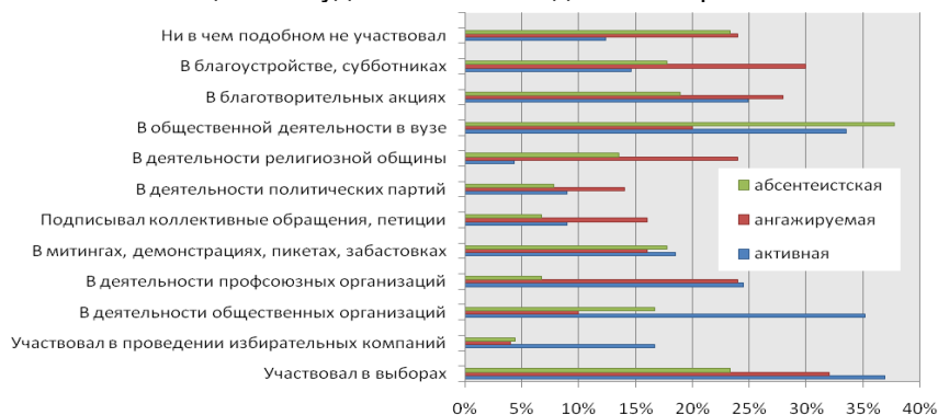
Рисунок 3 – Лично Вам приходилось за последний год участвовать в общественной и политической жизни?

В разрезе моделей гражданственности картина представляется более неоднородной (рисунок 3). Так, активисты предпочитают формы, требующие личного инициативного добровольного участия – деятельность в общественных организациях (35,2 %), проведение избирательных кампаний (16,7 %). Молодые люди с ангажируемой моделью гражданственности ориентированы на формы, требующие коллективного или обезличенного поведения, – мероприятия по обустройству и субботники (30,0 %), благотворительные акции (28,0 %), подпись коллективных обращений, петиций (16,0 %), а также мероприятия, требующие наличия авторитетного лидера, наставника – участие в деятельности профсоюзных организаций (24,0 %), религиозной общины (24,0 %), политических партий (14,0 %). Молодые люди с абсентеистской моделью демонстрация гражданского участия проявляли наибольшую активность в общественной деятельности в вузе (37,8 %), а остальные формы участия оказались с ними востребованы в значительно меньшей степени. Примечательно, что в митингах, демонстрациях, пикетах и забастовках за последний год принимали участие все категории молодежи практически в равной степени. Средний показатель протестной активности составил 17,6 % (почти каждый шестой участник опроса), что говорит о достаточно высоком конфликтном потенциале студенческой молодежи Северного Кавказа.