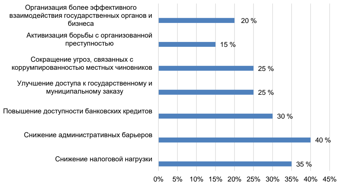
Рисунок 3 – Меры по совершенствованию системы экономической безопасности малого и среднего бизнеса в Астраханском регионе

Однако, несмотря на данные обстоятельства, к факторам, препятствующим развитию среднего предпринимательства в Астраханской области, следует отнести: