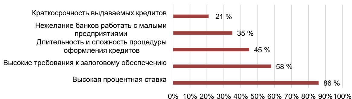
Рисунок 2 – Проблемы предпринимателей в получении кредитных ресурсов

На вопрос: «Какие проблемы являются наиболее существенными для малых и средних предприятий при обращении к банковским кредитным ресурсам?» респонденты ответили следующим образом (рисунок 2).