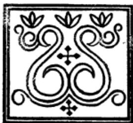
Рисунок 2 – Лировидный орнамент

для лировидного узора служила голова аргали. Форма изображения бараньей головы, уже в первом Пазырыкском кургане ставшая традиционной, дала начало мотиву, который очень часто встречается на находках из II Пазырыкского кургана [12, с. 70]. Данный мотив распространен в хакасском орнаменте и имеет древние корни. Это мотив «бегущая волна». С таштыкского времени в этом орнаменте проявляются арочные мотивы на изделиях из ткани. Традиционные криволинейные мотивы «бараньи рога» или растительные мотивы узора используют и до сих пор современные хакасские мастерицы в вышивках тамбурным швом национальной одежды [13, с. 61].