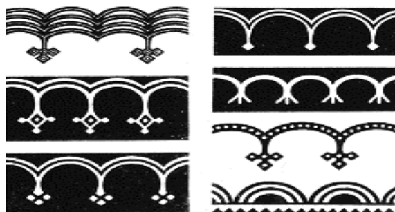
Рисунок 1 – Арочные мотивы в орнаментике якутов (по С.В. Иванову)

Особый интерес представляет небесный орнамент (рисунок 1). Якуты варьировали и передавали данный орнамент из поколения в поколение [7, с. 51]. Другое название небесного орнамента – «арочный» орнамент. С.В. Иванов провел аналогии между якутским арочным орнаментом и арочными мотивами хуннского орнамента. По его мнению, данный мотив является бесспорным свидетельством проникновения в якутский орнамент через курыканскую орнаментуку [8].