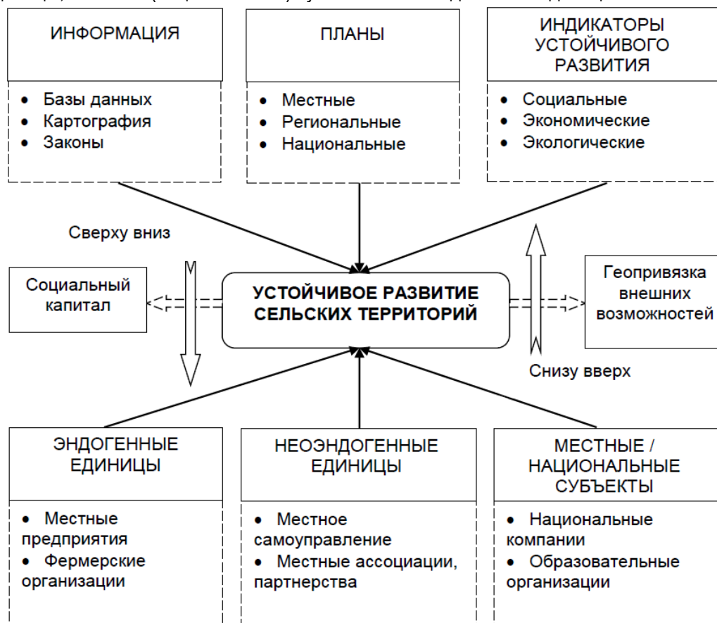
Рисунок 1 – Неоэндогенная модель организации устойчивого развития сельских территорий на региональном уровне

Предлагаемая неоэндогенная модель устойчивого развития сельских территорий (рис. 1) включает ряд элементов, функционирующих в рамках развития социального капитала: эндогенные единицы, местные (национальные) субъекты и неоэндогенные единицы.