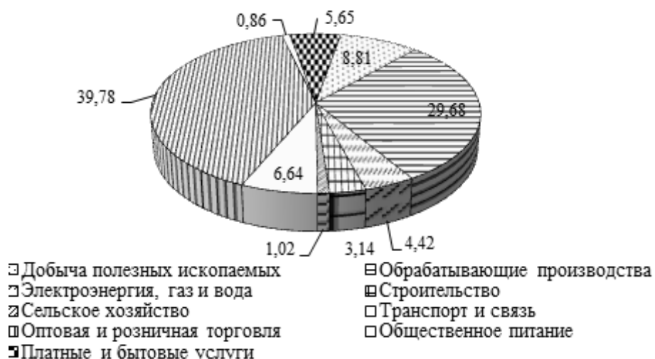
Рисунок 1 – Доля выполненных работ и услуг по видам экономической деятельности в Самарском регионе за январь – июнь 2015 г.

Степень участия действующих кредитных организаций в развитии Самарского региона, а именно в развитии основных хозяйствующих субъектов и предприятий, можно определить путем изучения объема выполненных работ и услуг и отгруженных товаров собственного производства организациями по видам экономической деятельности. Данный показатель позволяет выявить те отрасли, где посредством кредитования банки оказывают прямое воздействие на бесперебойную и нормальную деятельность предприятий. На рисунке 1 представлено детальное распределение объема отгруженных товаров, выполненных работ и услуг в разрезе основных видов экономической деятельности Самарского региона в процентном соотношении [3].