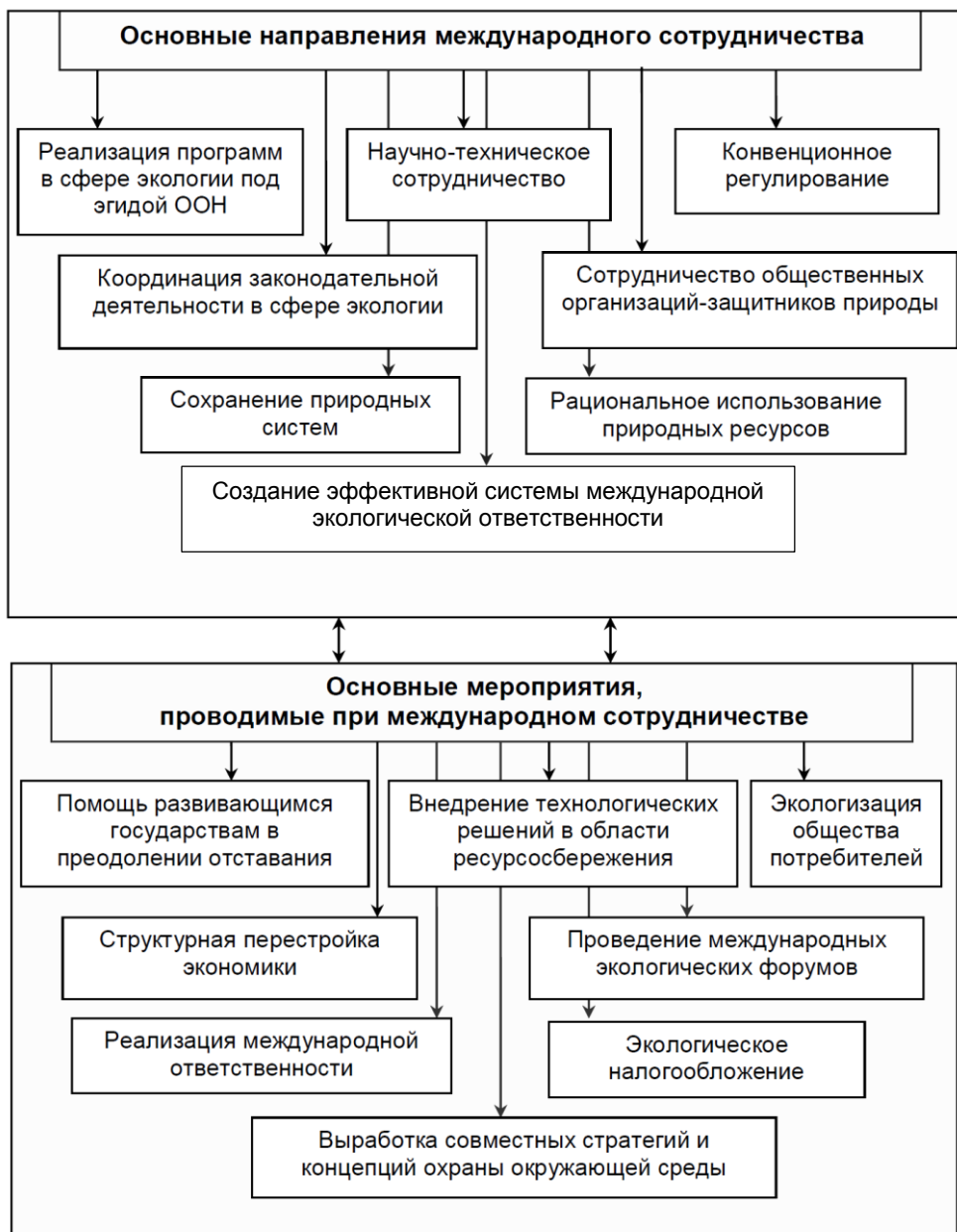
Рисунок 2 – Основные направления и мероприятия, обеспечивающие международное сотрудничество в природоохранной сфере

Основные этапы формирования международного экологического сотрудничества представлены в таблице 1.