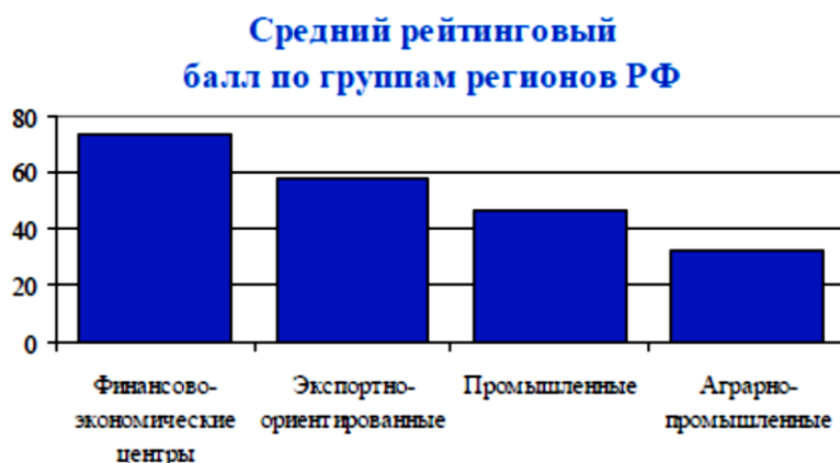
Рисунок 1 – Рейтинговый балл оценки субъектов Российской Федерации по группам на 2011 г. [3]

Из данных, отображенных на рисунке 1, становится понятным, что для полноценного развития региона недостаточно наличия узкоспециализированной отрасли экономики. Производственному сектору регионов необходимо сбалансированное комплексное развитие, основой для которого являются четко закрепленные и научно-обоснованные границы субъекта Российской Федерации [4, с. 7].