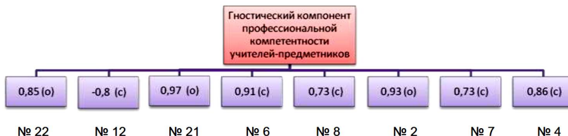
Рисунок 2 – Корреляционная плеяда «Гностический компонент профессиональной компетентности учителей»

Второй плеядой по весу, по количественным значениям корреляции является плеяда, где представлена корреляция уровня знаний учителей методики «Лист оценки профессиональной деятельности и личности учителя» с 8 субъективными показателями, 3 из которых относятся к объективной оценке и 5 – к субъективной. Вторую корреляционную плеяду по генеральному показателю можно обозначить плеядой профессиональных знаний, то есть она отражает гностический компонент профессиональной деятельности, поэтому целесообразней назвать ее «Гностический компонент профессиональной компетентности учителей» (рисунок 2).