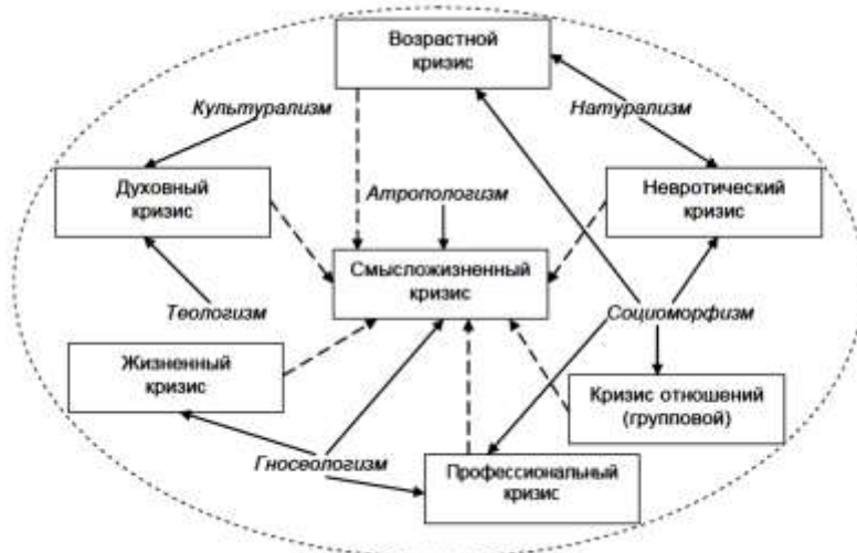
Рисунок 1 – Соотношение кризисов и подходов к пониманию развития человека

Обращает на себя внимание тот факт, что перечисленные виды кризисов достаточно интенсивно изучаются, но по отдельности, без учета возможных взаимосвязей между ними. В то же время, исследование таких взаимосвязей позволит проводить более глубокий феноменологический анализ кризисов как структурного образования в жизни и развитии человека. Ключевыми показателями в описании кризисов как взаимосвязанной системы являются их механизмы протекания и формы развития. Опираясь на размышления В.И. Слободчикова [16] о существующих подходах к пониманию развития человека (натурализм, социоморфизм, культурализм, теологизм, гносеологизм, антропологизм), можно представить специфику подходов к пониманию отдельных видов кризисов в контексте их движущих сил и особенностей проявления (рисунок 1).