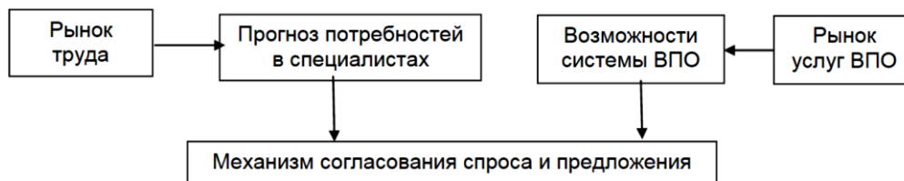
Рисунок 1 – Логическая схема согласования потребностей рынка труда и предложения услуг высшего профессионального образования

Мы считаем, что в идеале должна быть реализована следующая схема согласования потребностей рынка труда и предложения услуг высшего профессионального образования (рисунок 1).