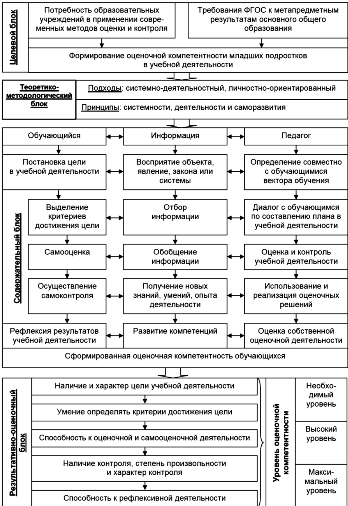
Рисунок 1 – Модель формирования оценочной компетентности обучающихся