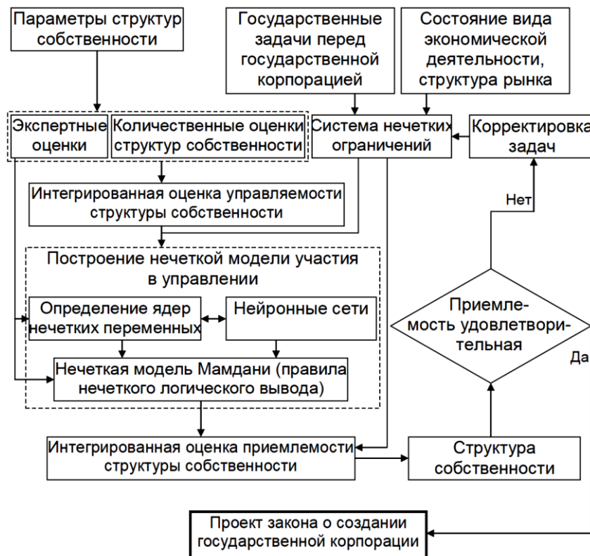
Рисунок 1 – Принципиальная схема выбора структуры собственности на основе модели нечеткого участия [3]

Сбор информации осуществляется в форме матриц нечетких отношений предпочтения, элементы которых отражают степень истинности высказываний в интервале от 0 до 1 о приоритете одной структуры собственности над другой по отдельно взятому из множества G критерию. В качестве степени истинности могут быть использованы и лингвистические выражения, которые трансформируются в числовые выражения по специальному алгоритму. При построении нечетких моделей необходимым условием является представление входных и выходных параметров нечеткой модели в форме лингвистических переменных, значениями которых являются нечеткие переменные.